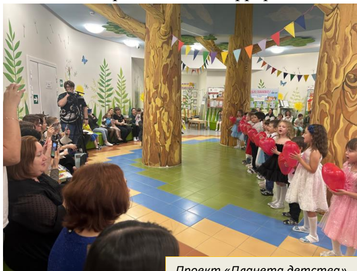
Проект «Планета детства»

В течение года педагогами оформлены папки-передвижки: «Профилактика вирусных и простудных заболеваний», «О пользе закаливания», «Роль конструирования в развитии детей дошкольного возраста» (старший возраст), «Как приучить ребенка есть овощи и фрукты», «Об опасности пластиковых окон», «Пожарная и антитеррористическая безопасность», «Игры на прогулке», и т.д.