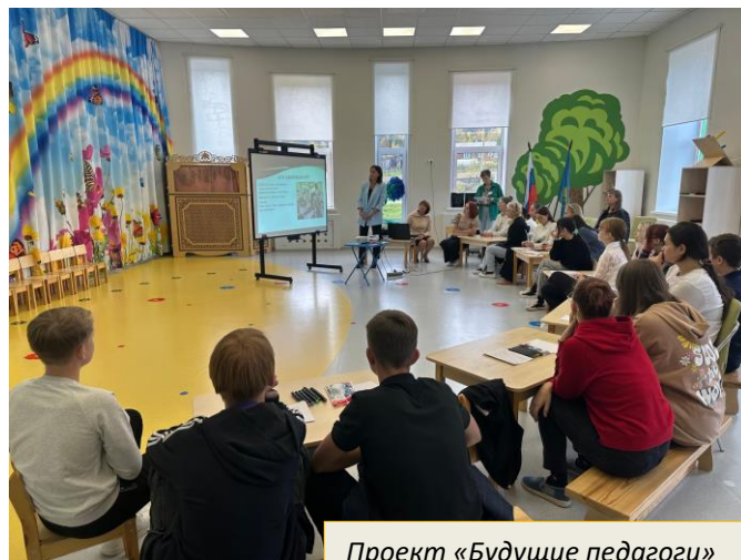
Проект «Будущие педагоги»