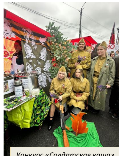
Конкурс «Солдатская каша»