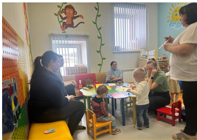
Встреча консультативного пункта «Гнездышко»

В 2021 – 2022 учебном году в результате участия в краевом конкурсе поддержки реализации проектов молодых педагогов Красноярского края на предоставление грантов в форме субсидий образовательным организациям наш проект «Консультативный пункт «Гнездышко» одержал победу и грантовая поддержка составила 423 270 руб. на переоборудование помещения в ДОУ под помещение Консультативного пункта.