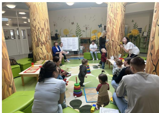
Встреча консультативного пункта «Гнёздышко»

С апреля 2024 г. консультативный пункт для детей, не посещающих детский сад провел ряд организованных мероприятий. С 2020 года деятельность консультативного пункта носит постояннодействующий характер, по графику работы заведующего, старшего воспитателя, узких специалистов, была организована консультативная деятельность по запросам родителей. А также размещены консультации на официальном сайте МБДОУ № 8 «Иволга». В 2023-2024уч.г. проведено 5 организованных встреч по темам пяти образовательных областей.