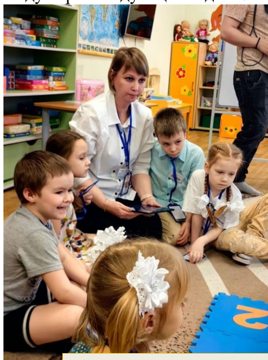
Конкурс «Воспитатель года 2024»