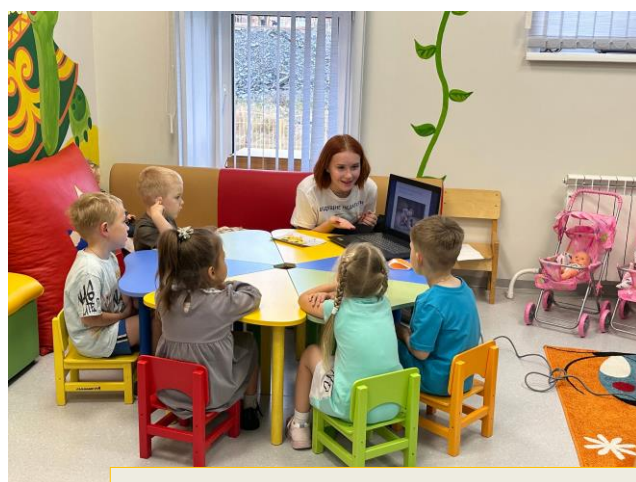
Реализация проекта «Будущие педагоги»

Развивающую предметно-пространственную среду составляют не только приобретаемое игровое оборудование и игрушки, но и бросовый материал, атрибуты к игре, изготовленными своими руками, многофункциональные предметы, что активно используется педагогами всех групп. Разнообразная, сменяемая предметно-пространственная среда групп является составляющей образовательного процесса и способствует развитию разнообразных видов деятельности у детей.