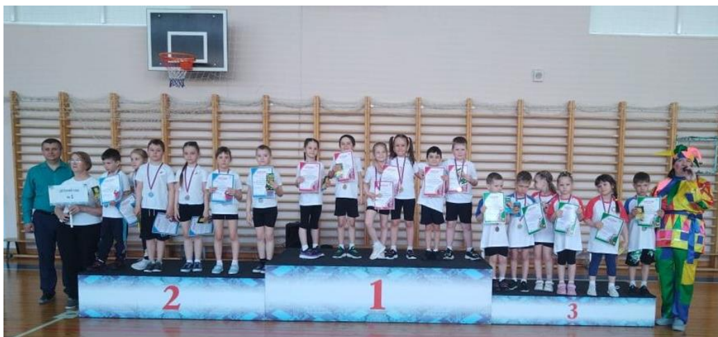
Победители «Младше всех» 2024

Педагоги ДОУ своим примером детям привычку здорового образа жизни и в октябре 2023года команда из числа педагогов и сотрудников МБДОУ № 8 «Иволга» приняла участие в районной спартакиаде среди учреждений района и заняла 2 место.