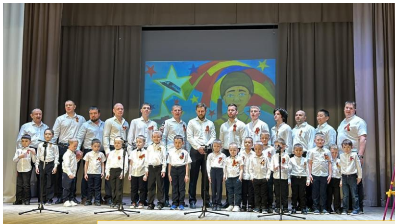
Фестиваль хоровых коллективов ко Дню Победы