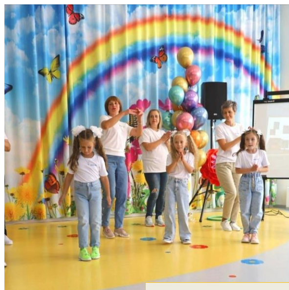
5 лет детскому саду

Для обеспечения профессионального роста педагогов, формирования их методологической культуры, личностного профессионального роста, использования ими современных педагогических технологий, предлагается участие в различных конкурсах, он-лайн тестированиях, викторинах, конференциях, районных методических объединениях. Это стимулирует целенаправленное, непрерывное повышение профессиональной компетентности педагогических работников ДОУ.