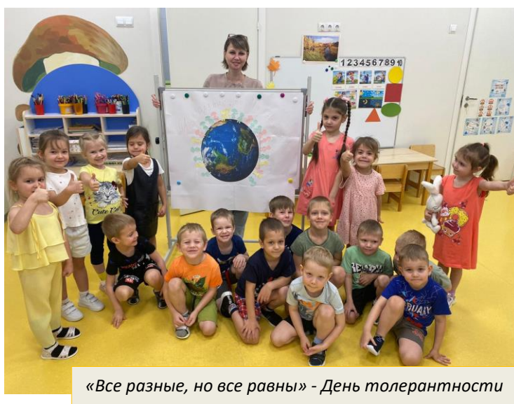
«Все разные, но все равны» - День толерантности

и праздники вызывают у детей положительный эмоциональный отклик. Так для детей организованы такие приёмы и формы работы, как: «Утренний» и «Вечерний круг», «Детские мастер-классы», «Клубный час», «Час игры и т.д. Сохраняя традиции родной культуры, в течение учебного года были организованы мероприятия в рамках Всероссийской акции «Ценности будущего в традициях народной культуры» и традиционные праздники: «Новый год», «23 февраля», «8 марта», 12 апреля - День космонавтики, 9 мая – День Победы, «День народного единства», «День России» и т.д.