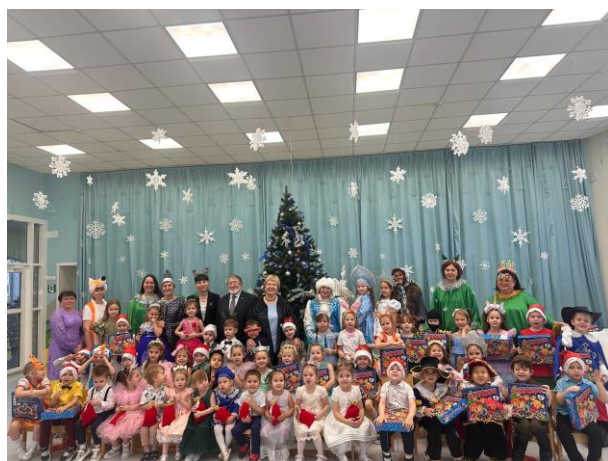
«Новогоднее развлечение» с меценатами