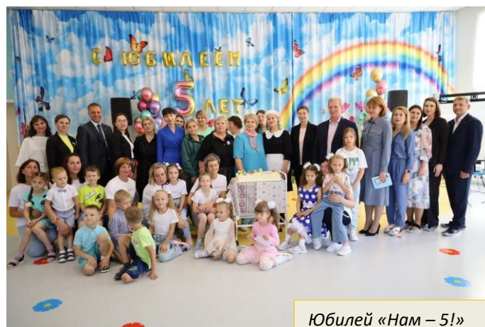
Юбилей «Нам – 5!»