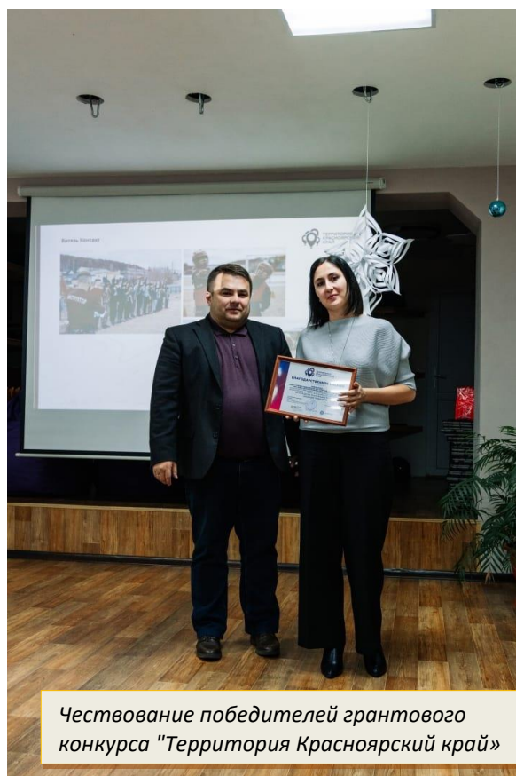
Чествование победителей грантового конкурса "Территория Красноярский край"