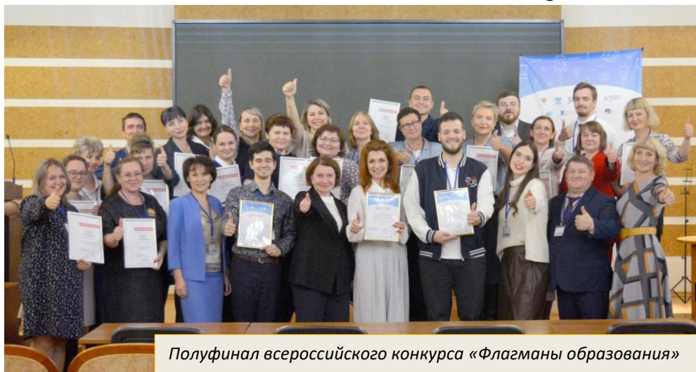
Полуфинал всероссийского конкурса «Флагманы образования»

С 2022 года МБДОУ № 8 «Иволга» является сетевым учреждением краевого сетевого методического объединения «Практики создания условий для индивидуализации педагогического процесса в ДОУ» (КИПК). Промежуточный результат работы был представлен на Дне открытых дверей для сетевых ДОУ в МБДОУ № 8 «Иволга», а также на экспертной сессии практик сетевых ДОУ (май, 2024 г.).