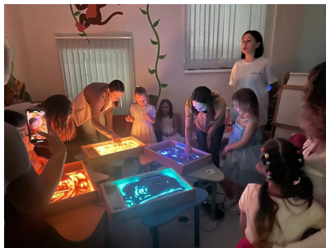
Реализация проекта «Планета детства...»

Педагогическим коллективом разработано Положение, которое регулирует деятельность ДОУ, по организации инклюзивного образования детей с ограниченными возможностями здоровья (далее – ОВЗ) в функционирующей группе типично развивающихся сверстников (группа общеразвивающей направленности)