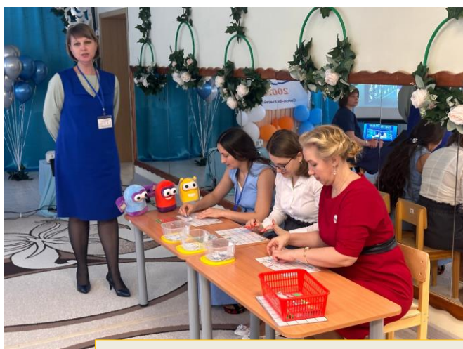
Муниципальный этап краевого конкурса «Воспитатель года»