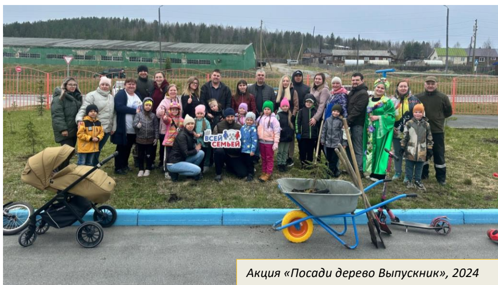
Акция «Посади дерево Выпускник», 2024

В ДОУ оборудован музыкально-физкультурный зал, оснащенный